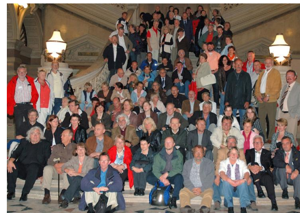
Bundesarbeitstagung in Wien 2007

Bundesarbeitsgemeinschaft der Lehrerinnen und Lehrer im Justizvollzug e. V.